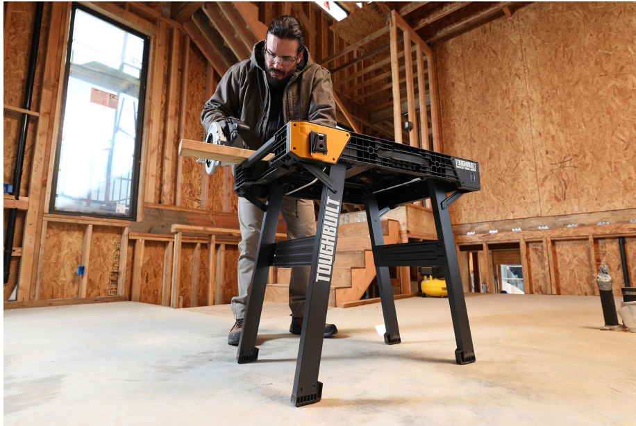
TB Quickset Workbench 1.jpg